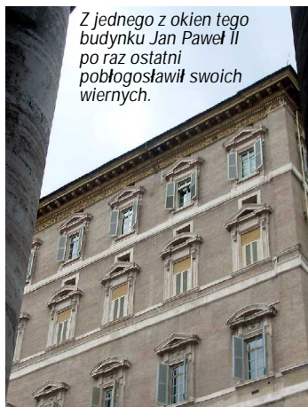
Z jednego z okien tego budynku Jan Paweł II po raz ostatni pobłogosławił swoich wiernych.

Książa mają tysiąc razy ciężiej. Są na widoku, ludzie przypatrują się im, słuchają ich i przysłuchują się im.