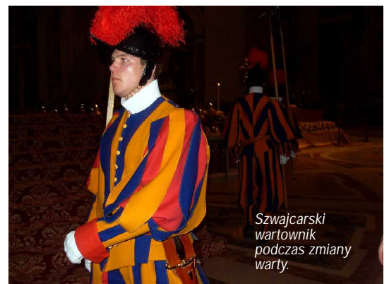
Szwajcarski wartownik podczas zmiany warty.

Benedykt XVI często nazywa Jana Pawła II swoim „ukochanym Poprzednikiem”. Niech Błogosławiony Jana Paweł II również dla nas