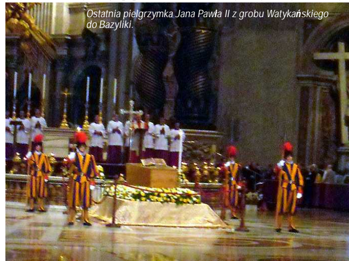
Ostatnia pielgrzymka Jana Pawła II z grobu Watykańskiego do Bazyliki.

To była niezapomniana pielgrzymka na beatyfikację papieża Ja-