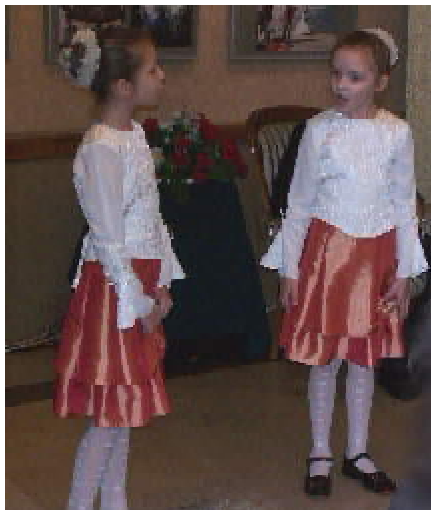
Konsulat Generalny RP w Kaliningradzie