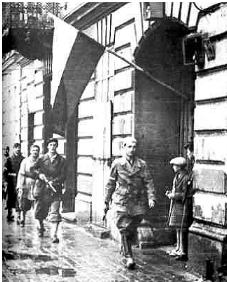
Wybuch powstania - 01.08.1944, godz. 17.00

Oddziały Armii Krajowej podjęły w sierpniu 1944 r. walkę zbrojną celem wyzwolenia Warszawy spod okupacji niemieckiej i umożliwienia podjęcia przez władze państwa podziemnego jawnej działalności przed wkroczeniem do stolicy Armii Czerwonej, która opanowała lewobrzeżną część Warszawy. Władze Związku