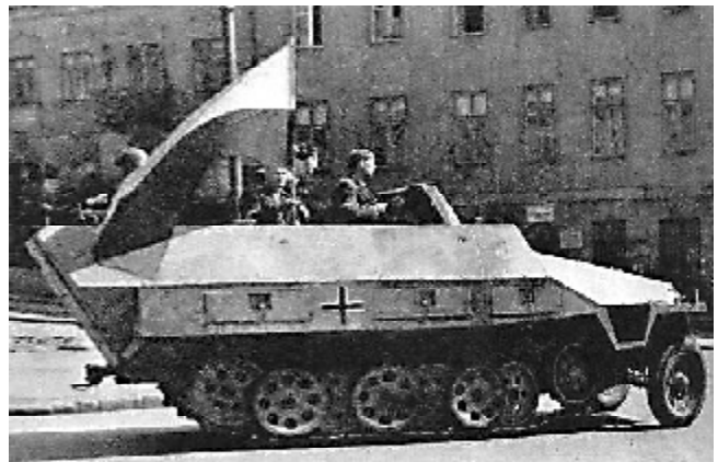
Polacy w zdobyczym wozie bojowym

Powstanie Warszawskie było logicznym ukoronowaniem akcji niepodległościowej rozwijanej w czasach okupacji nazistowskiej i sowieckiej. Przegrało, bo międzynarodowy układ sił i interesów w momencie jego wybuchu skazywał je na klęskę. Przekształciło się