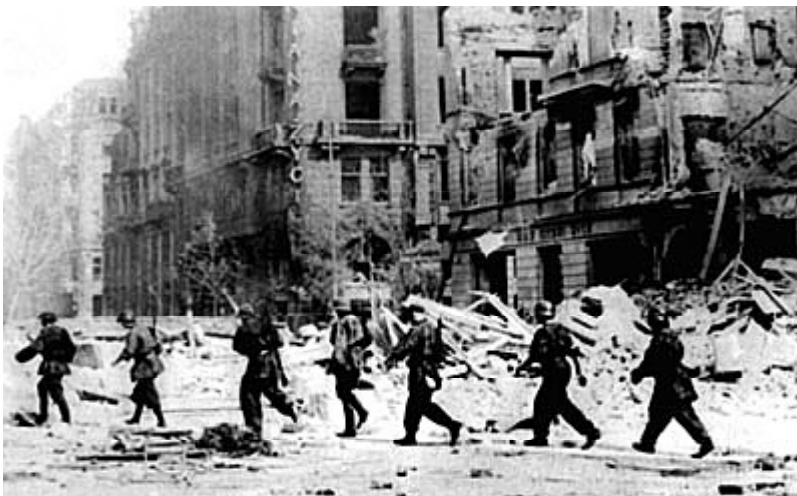
Oddział powstańczy w ruinach stolicy

jednak w bohaterski mit patriotyczny i wolnościowy, który odżywał przy kolejnych przełomach powojennej historii Polski. Inspirował moralnie młodsze pokolenia włączające się do opozycji demokratycznej i ruchu Solidarności. Ciągłość historyczna nie została zerwana i wydała owoce. Wymarzona przyszłość, w której Polacy będą żyli we własnym niepodległym państwie demokratycznym, przyszła szybciej niż się spodziewano i bez przelewu krwi. Można w tym dojrzeć zwycięstwo wszystkich, którzy tego szczerze pragnęli – w tym i powstańców Warszawy, choć dla nich droga prowadziła przez mękę, a marzenie spełniło się straszliwie późno.