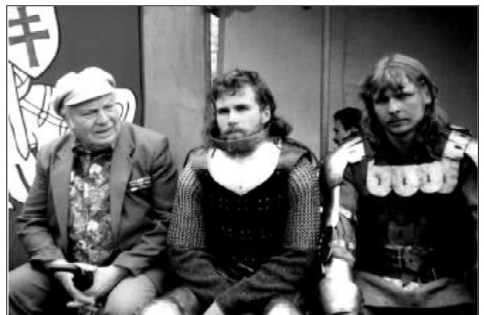
Dziś już nie ma prawdziwych rycerzy... (wspomnienia z Dnia Miasta 2000)