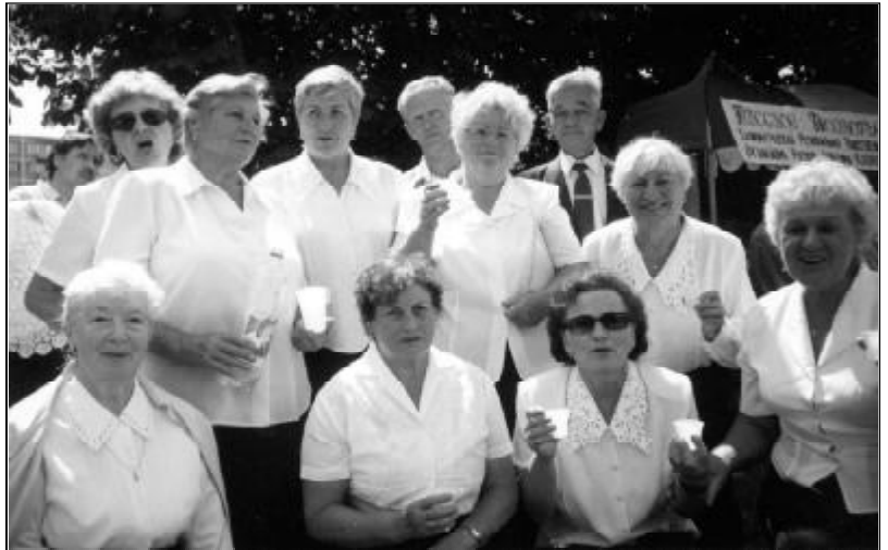
Jak zawsze, wspaniale wypadł chór Wspólnoty

Bardzo widowiskową częścią tego święta jest niewątpliwie pochód jego uczestników. Różnobarwna kolumna złożona z mnóstwa amatorskich zespołów artystycznych oraz przedstawicieli kaliningradzkich mniejszości narodowych, idąc od placu Zwycięstwa przez centrum grodu w stronę wyspy z prastarą Katedrą, ukazuje się widzom, jako zapowiedź dalszych ciekawych wydarzeń. Jak nigdy wcześniej masowy był udział w tym świątecznym pochodzie kaliningradzkiej Polonii. Wkraczającym na wyspę otwierał się widok