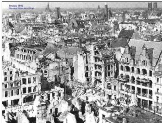
WROCLAW, Stare Miasto, rok 1946

stosunków między naszymi państwami i narodami, w którym jak na dłoni widoczna jest potrzeba współdziałania. Ważna jest też wspólnota interesów. Łączy nas potrzeba ugruntowania rozwoju ekonomicznego, nasze