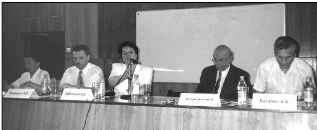
Prezydium seminarium.

W referacie przedstawiona była również krótka historia powstania powojennej Polonii Kaliningradzkiej, podkreślono wyjątkową rolę parafii katolickiej w uzyskaniu tożsamości narodowej przez Polaków zamieszkałych w Obwodzie Kaliningradzkim.