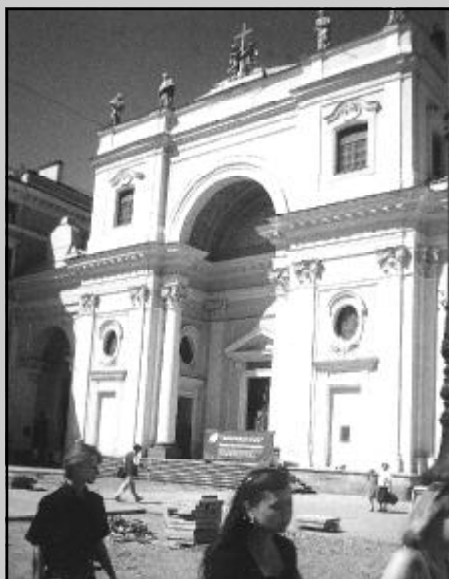
Kościół Katolicki na Newskim prospekcie w Sankt-Peterburgu w trakcie restauracji.