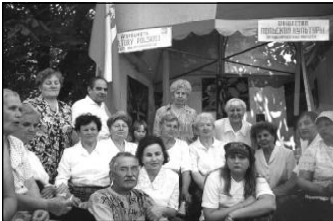
Przed „polskim” namiotem.