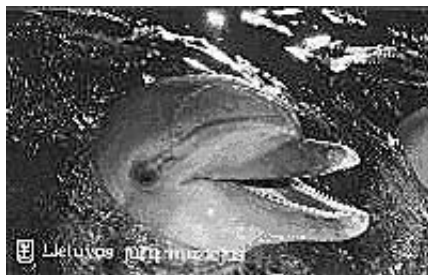
Jeden z delfinów w Litewskim Muzeum Morskim.