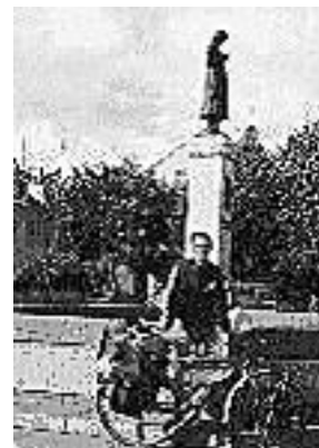
Pasterka - stary symbol Kłajpedy