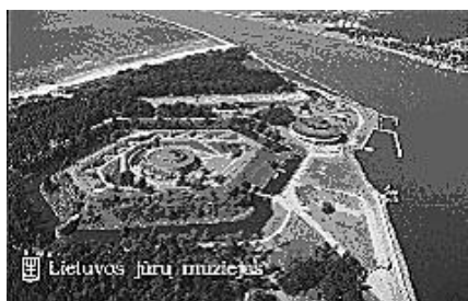
Smilgyne - czyli sam koniec Mierzei Kurońskiej - z lotu ptaka.

Wygląda to tak: najpierw szlaban, żołnierz wydaje ‘talonik’ (białą karteczkę, na której wpisuje ‘welosyped’ oraz grażddaństwo: ‘Polsza’). Potem kilometr jedziemy szosą przez las. Następnie szlaban, wstępna kontrola paszportu i talonika, potem klasyczne przejście z dwiema budkami, w których najpierw kontrola celna, a potem kontrola paszportowa (komputerowa). Celna kontrola jest dla rowerów symboliczna, ale na paszportowej zaczęli się przyglądać mojemu voucherowi i pytają, co myśmy przez trzy dni robili w Obłasti? Okazało się, że nasz voucher nie jest podstemplowany przez hotel. Tłumaczę, że my pierwszy raz i że spaliśmy na kempingu w Zelenogradsku a nie w Kaliningradzie. Jeszcze kilkanaście pytań, m.in. o cenę (na dołączonym rachunku widnieje 5 zł) i o miejsce nabycia vouchera. Odpowiadam na wszystkie pytania, ale widzę, że chyba zdaniem pogranicznika, nie jest ten voucher zbyt przekonujący. W końcu przestał być tak dociekliwy i machnął ręką. Opuszczamy strefę, celnicy pod kolejnym szlabanem, gdzie oddajemy talonik. No i jesteśmy na Litwie . Punkt kontrolny litewski znajduje się dwa kilometry dalej. W jednym miejscu załatwia nas celnik obrzucając zmęczonym spojrzeniem i policjant-pogranicznik, który po wbiciu stempla mówi zniecierpliwiony: „W sio, pajechali”. Nieco zdziwieni tak szybkim obrotem sprawy (wszystko zamknęło się w 2 minutach) ruszamy. > str. 9