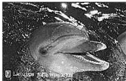
Jeden z delfinów w Litewskim Muzeum Morskim.