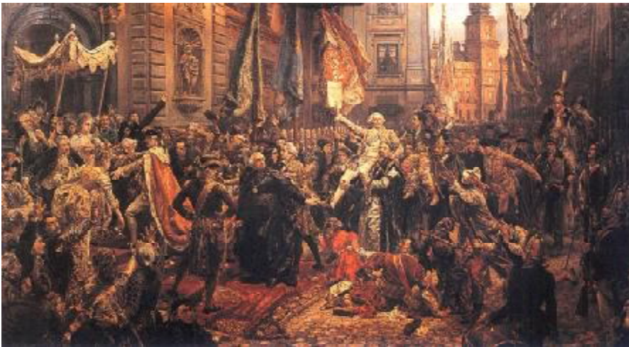
Jan Matejko. Konstytucja 3 Maja 1791 r.

nas namiętności sprawować mogą dla dobra powszechnego, dla ugruntowania wolności, dla ocalenia Ojczyzny naszej i jej granic z największą stałością ducha, niniejszą konstytucję uchwalamy i tę całkowicie za świętą, za niewzruszoną deklarujemy, dopóki by naród w czasie prawem przepisany, wyraźną wolą swoją nie uznał potrzeby odmienienia w niej jakiego artykułu. Do której to konstytucji dalsze ustawy sejmu teraźniejszego we wszystkim stosować się mają”.