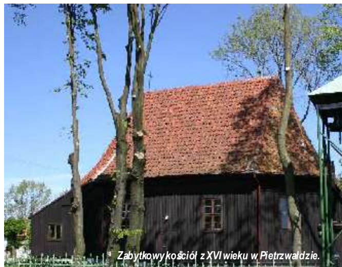
Zabytkowy kościół z XVI wieku w Pietrzwałdzie.

rancji, chociaż luteranizm do Prus książęcych wkroczył szerokim frontem i opanował całe Mazury, ale przez pewien czas w kościołach przejętych przez ewangelików były odprawiane nabożeństwa dla katolików po polsku, w szkołach uczono dzieci polskie po polsku, w urzędach i sądach można było załatwiać sprawy w języku polskim. W drukarniach drukowano kancjonały w języku polskim, śpiewniki i inne wydawnictwa, w tym gazety oraz kalendarze dla mazurów (drukarnie: Elk, Morąg, Ostróda, Olsztynek, Olsztyn, Szczytno oraz w innych miastach).