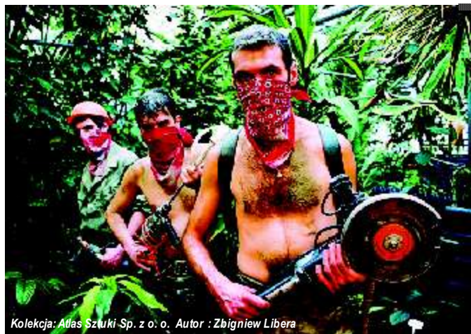
Kolekcja: Atlas Sztuki Sp. z o.o. Autor: Zbigniew Libera