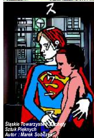
Śląskie Towarzystwo Zachęty Sztuk Pięknych Autor: Marek Sobczyk