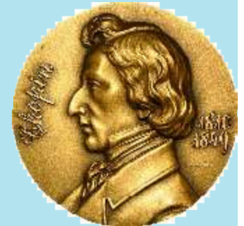
Medal poludniowoamarykański Chopina 2010 r.

Postać genialną w swojej istocie nie można dokońca scharakteryzować słowem. Całe swoje nat-