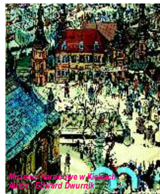
Muzeum Narodowe w Krakowie Autor: Edward Dwurnik