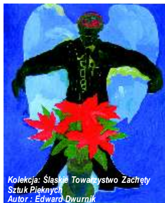
Kolekcja: Śląskie Towarzystwo Zachęty Sztuk Pięknych Autor: Edward Dwurnik