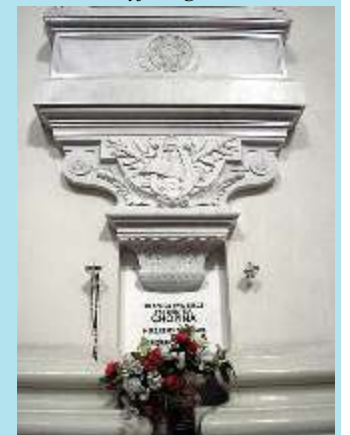
Epitaforium z sercem F. Chopina w kościele Sw. Krzyża w Warszawie

opracowanie i przekład z rosyjskiego W. Wasiliew