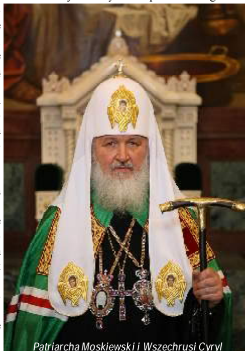
Patriarcha Moskiewski i Wszechrusi Cyryl