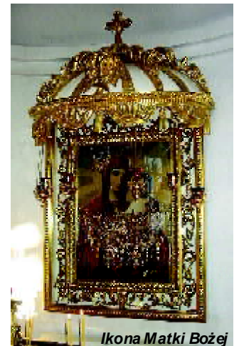
Ikona Matki Bożej „Skoroposłusznica” w świątyni w Bagrationowsku