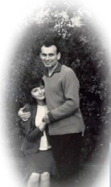
Kaliningrad, 1964 r. Pierwsze wakacje młodożeńców z Leningradu

PETERSBURG, wtedy jeszcze tak podobny do niezrównanego Petersburga XIX wieku. Architektura w jej srogiej majestatyczności nie mogła nie wychowywać i uszlachetniać człowieka.