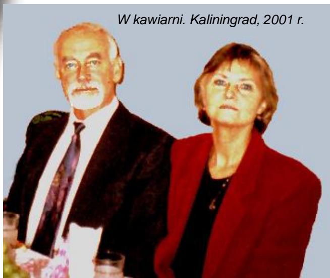
W kawiarni. Kaliningrad, 2001 r.

Kultura w jej różnorodności była przez nas wchłaniana. Wielka literatura, poezja, muzyka. Ty i ja –