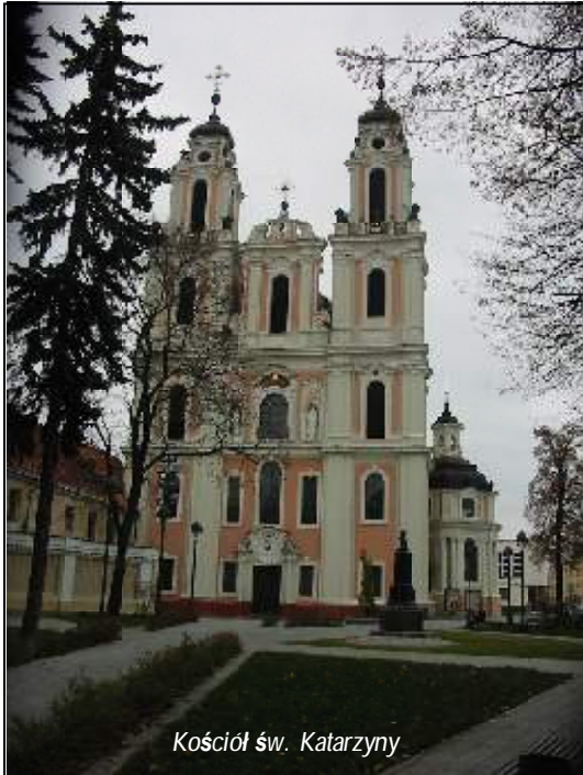
Kościół św. Katarzyny

W przyszłym roku Litwa będzie świętować 1000-letni jubileusz pierwszej wzmianki kraju w dokumencie pisemnym. A jej stolica Wilno razem z austriackim Linzem została ogłoszona kulturalną stolicą Europy 2009. Przez cały rok będą tu odbywać się ciekawe imprezy, i miasto gościnnie otworzy drzwi dla turystów z całego świata.