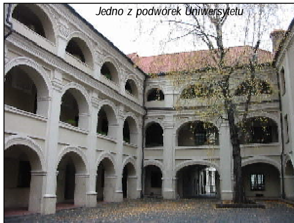
Jedno z podwórek Uniwersytetu

Po obejrzeniu katedry kierujemy się na ulicę Bernardinu. Tutaj w domu nr 12 znajduje się muzeum Adama Mickiewicza. Sam budynek zbudowano w pierwszej połowie XVII wieku. W roku 1822 Mickiewicz napisał tu poemat „Grażyna”. Muzeum uroczysto otwarto w 1955 roku na cześć stułetniego jubileuszu Adama Mickiewicza.