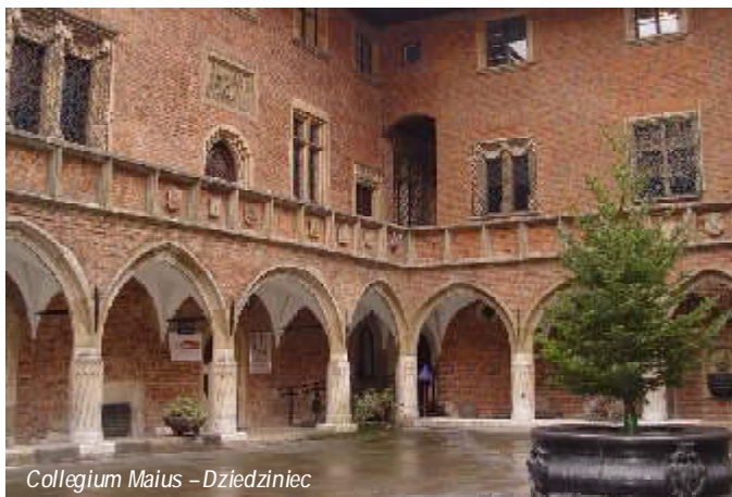
Collegium Maius – Działadziniec

Na szkolenie do Krakowa przyjechało 20 redaktorów różnych wydawnictw polonijnych z Litwy, Białorusi, Ukrainy, Czech, Mołdawii i Rosji. Z wieloma z nich spotkałam się na wcześniejszych konferen-