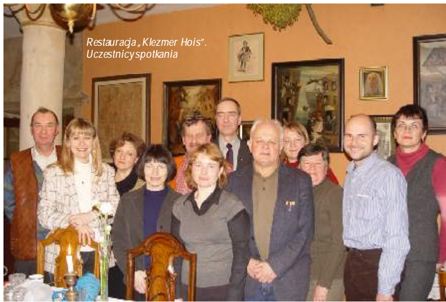
Restauracja „Klezmer Hois”. Uczestnicy spotkania